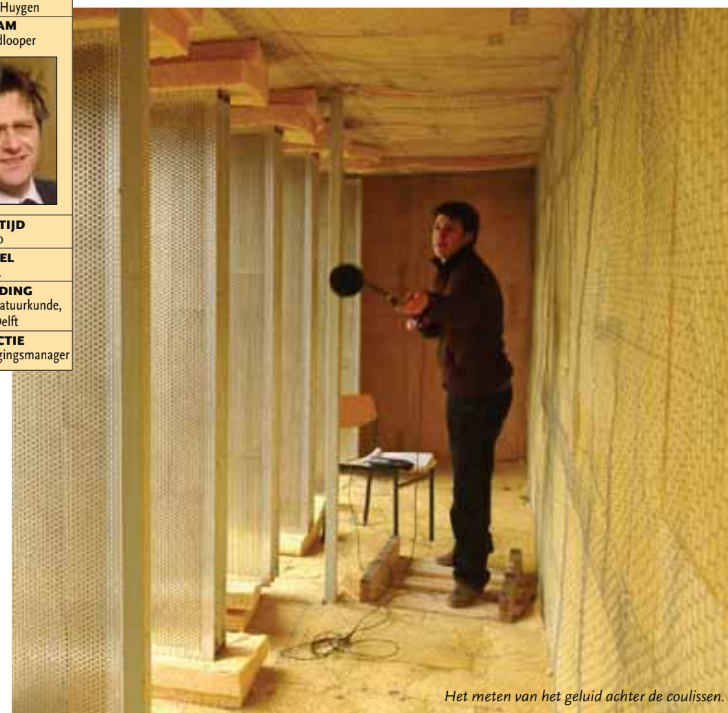
Het meten van het geluid achter de coulissen.